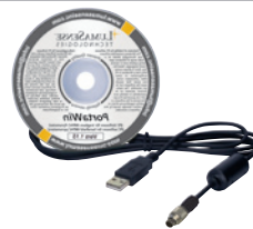
PortaWin-CD 和 USB 线

PortaWin 是一款适用于所有手持式红外测温仪的软件。测温仪可以通过 USB 接口连接到电脑。从而能够随时读出测量值、永久储存和检索。另外，软件提供一些有用功能如测量值图形显示、监控、记录和分析。